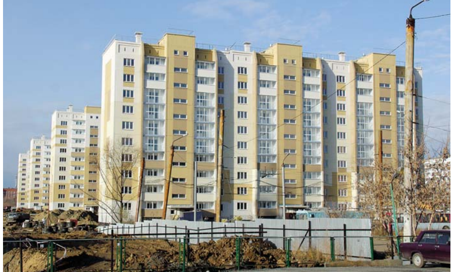
Дома по улице Братьев Кашириных