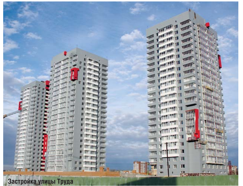
Застройка улицы Труда

Кроме указанных домов были построены: дом по ул. Пекинской, 25-б в Металлургическом районе (9255 кв. м; застройщик ООО Жилой комплекс «Пекинский»), 16-этажный дом со встроенно-пристроенными помещениями (2611 кв. м) по ул. Сони Кривой, 24 в Центральном районе (6479 кв. м; застройщик ООО УО «Школьник»), дом по ул. Горной в пос. Новосингелазово в Советском районе (10361 кв. м; застройщик