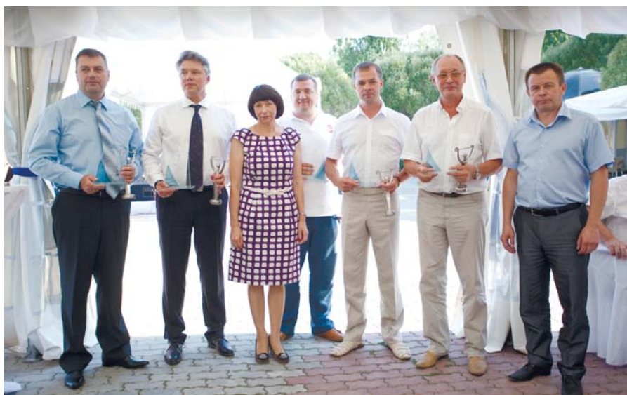
Награждение победителей конкурса «Строитель года» в 2012 году

Союз строителей активно участвует в организации и проведении строительных форумов, конференций, семинаров. Только в прошлом и начале нынешнего года было проведено четыре строительных Форума, несколько практических конференций, которые стали площадкой для делового, конструктивного диалога с властными структурами, коллективной выработки путей развития строительной отрасли нашего региона.