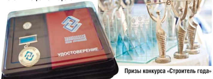
Призы конкурса «Строитель года»